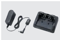
BC-227 急速充電器 (ACアダプターBC-123S付属)