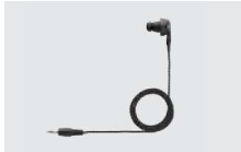
EH-15B イヤホン (プラグ:φ2.5mm) (HM-163MC、HM-238MCと組み 合わせて使用)