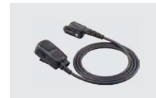
HM-238MC 近目発売 サブPTTスイッチ機能対応 タイピン型マイクロホン (EH-15B、 SP-26、SP-28と組み合わせて使用)