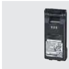
BP-303 (付属品と同一) リチウムイオンバッテリーパック (Min:3200mAh、Typ:3350mAh)