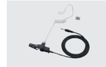
SP-27 チューブイヤホン (プラグ:φ3.5mm) (HM-222、AD-135と組み合わせて 使用)