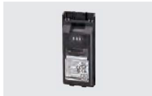
BP-302 リチウムイオンバッテリーパック (Min:1950mAh、Typ:2010mAh)