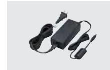
BC-228 ACアダプター (BC-226用の電源)