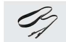
MB-57L ショルダーストラップ (LC-195と組み合わせて利用)