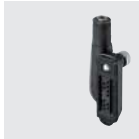
AD-135 イヤホンジャックアダプター (SP-16B、SP-16BW、SP-27、 SP-29、SP-40と組み合わせて使用)