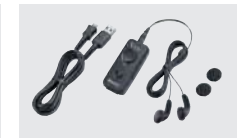
VS-3 Bluetooth® ヘッドセット