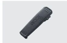
MB-133 (付属品と同一) ベルトクリップ