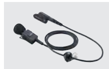
HM-163MC タイピンマイクロホン (EH-15B、SP-26、SP-28と組み合 わせて使用)