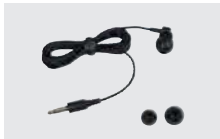
SP-40 イヤホン (プラグ:φ3.5mm) (HM-222、AD-135と組み合わせて使用)