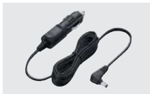
CP-23L シガレットライターケーブル (BC-227用)