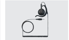
SP-28 耳かけ型イヤホン (プラグ:φ2.5mm) (HM-163MC、HM-238MCと組み 合わせて使用)