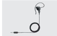
SP-16B/SP-16BW (ロングタイプ) 耳かけ型イヤホン (プラグ:φ3.5mm) (HM-222、AD-135と組み合わせて 使用)