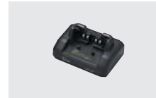
BC-226 急速充電器 (最大5台まで連結可能)