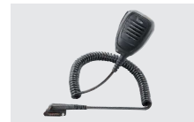
HM-222 防水スピーカ-マイクロホン (SP-16B、SP-16BW、SP-27、 SP-29、SP-40と組み合わせて使用可能)