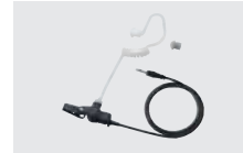
SP-26 チューブイヤホン (プラグ:φ2.5mm) (HM-163MC、HM-238MCと組み 合わせて使用)