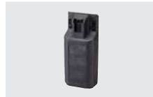
BP-305 近目発売 アルカリ乾電池ケース (単3形アルカリ乾電池5本)