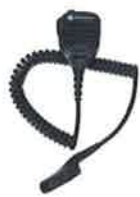
PMMN4067 IMPRES™ リモートスピーカーマイク