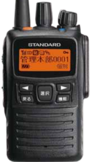
標準構成品:本体、アンテナ、ベルトクリップ 技術基準適合証明取得機種